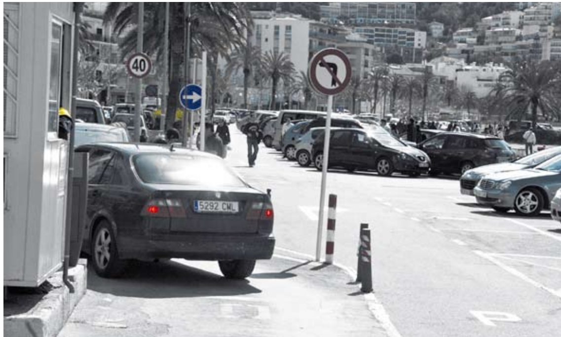
UNA SORTIDA COMPLICADA. El gir de gairebé 90 graus dificulta molt la visibilitat dels conductors a l'hora de sortir ÀNGEL REYNAL

Segons ha explicat el regidor de Via pública de Roses, Paco Mar-